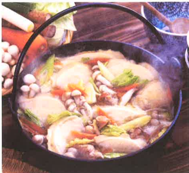
青森県八戸市の郷土料理「せんべい汁」 （写真はイメージです）